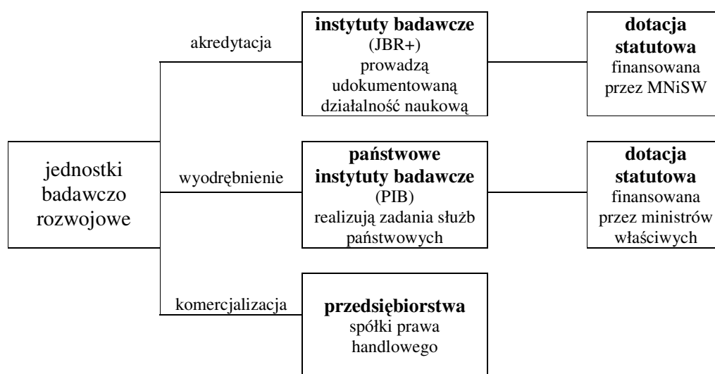
Schemat 2. Zmiany w organizacji JBR

Następnym etapem będzie stworzenie warunków prawnych do funkcjonowania związków naukowych i naukowo-przemysłowych z udziałem poszczególnych kategorii instytutów, związków posiadających lub nieposiadających osobowość prawną, takich jak sieci naukowe, konsorcja naukowo-przemysłowe, centra badawcze, holdingi, duże organizacje badawcze – na wzór rozwiązań istniejących w krajach UE.